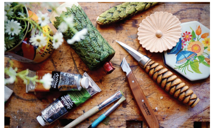
Mönsterskäring och linoljefärg.