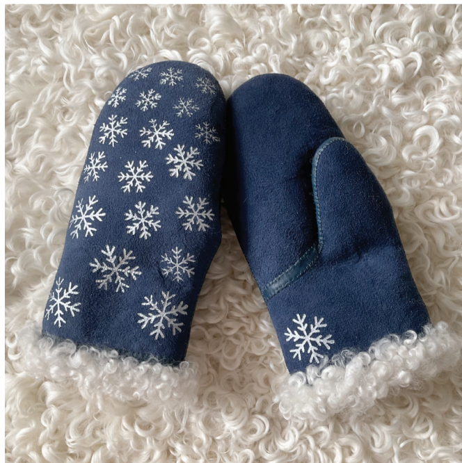
Skinnavantar med blocktryck.